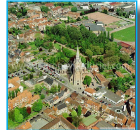
Vue de Hazebrouck

Le choix de la délégation de service publique, quelles modalités ?