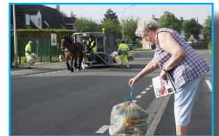
Dépôt des déchets à l'arrivée du cheval territorial

Cette rencontre vous permettra d'aborder plus en détail les questions d'ordre technique. Quels sont les coûts de ce service (équibenne, etc.) ? Quel est le matériel utilisé ?